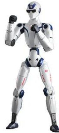
도표 6. 유니트리외의 휴머노이드 로봇인 R1

* Images shown are of the prototype. Final appearance and details are subject to the actual product.