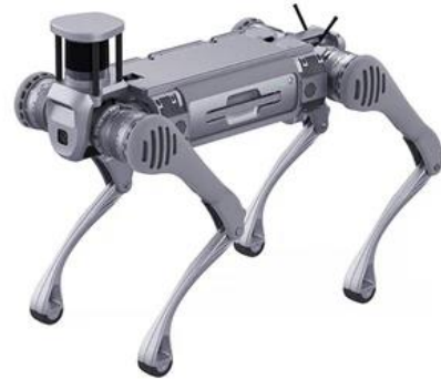
도표 8. 유니트리외의 사족보행 로봇인 B2