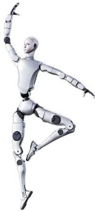
도표 7. 유니트리외의 휴머노이드 로봇인 H2