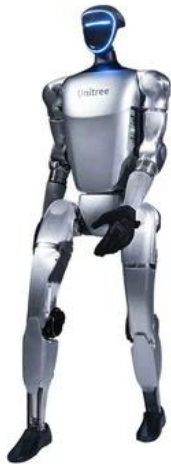
도표 5. 유니트리외의 휴머노이드 로봇인 G1