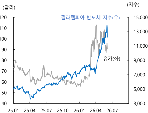
그림1. 반도체 주가 조정과 유가 불안 지속 등은 원화 약세 압력을 높이는 재료