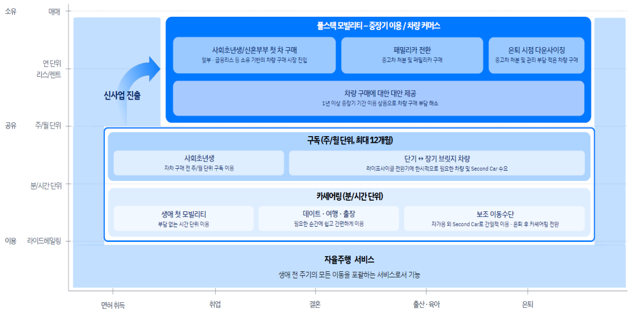
그림1 쏘카의 풀스택 모빌리티 구축 로드맵