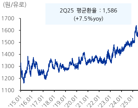
도표 6. 원/유로 환율