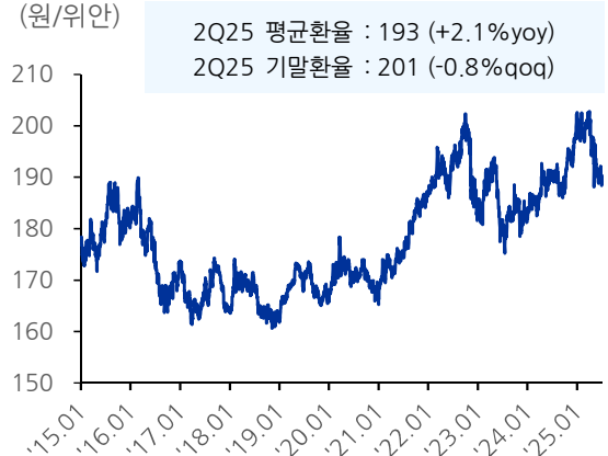
도표 5. 원/위안 환율