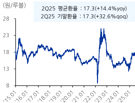
도표 8. 원/루블 환율