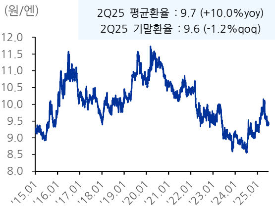
도표 9. 원/엔 환율