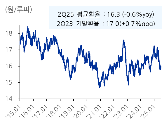
도표 7. 원/루피 환율