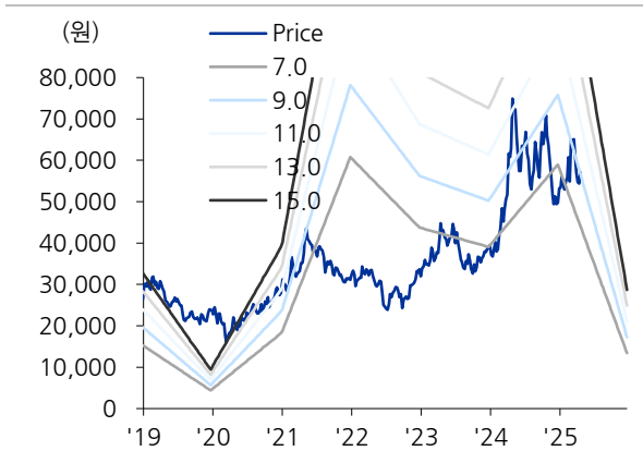
도표 2. PER Band