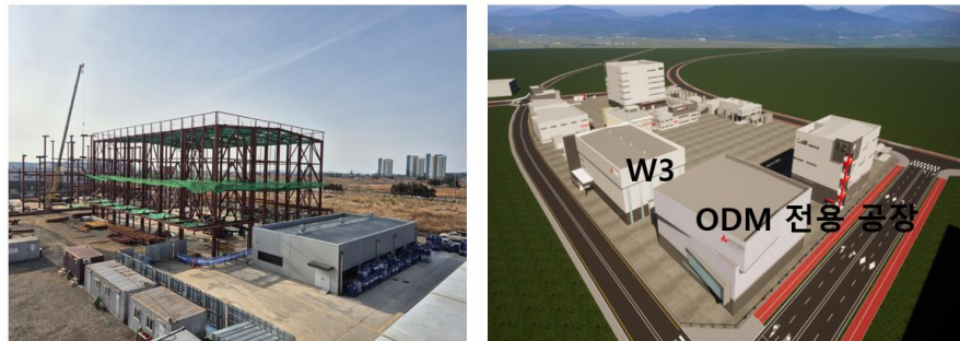
도표 1. 장항공장 부지에 건설중인 ODM 공장(OTC 대응)

2025년 6월 준공 예정 (연면적 4천 평, 지상 4층 규모, 연간 500억 CAPA)