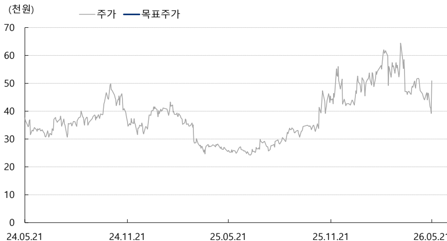
한올바이오파마 최근 2년간 목표주가 변동추이