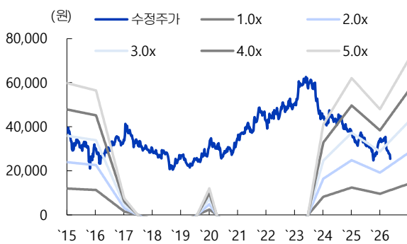
[도표 4] 한국전력 PER Band