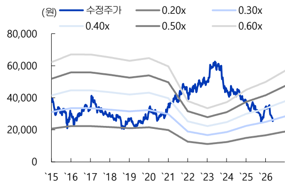
[도표 5] 한국전력 PBR Band