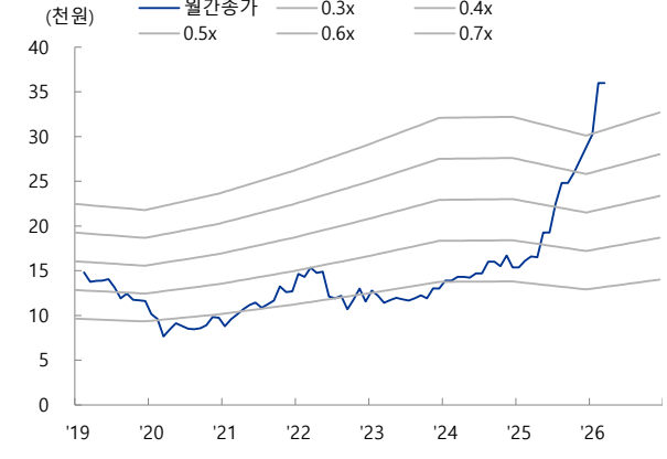
[도표 4] 우리금융지주 PBR Band 차트