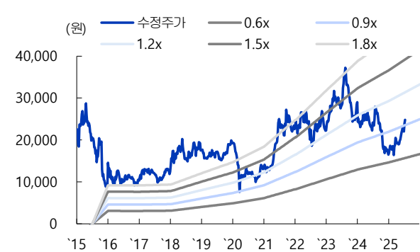
[도표 5] 삼성 E&A PBR Band