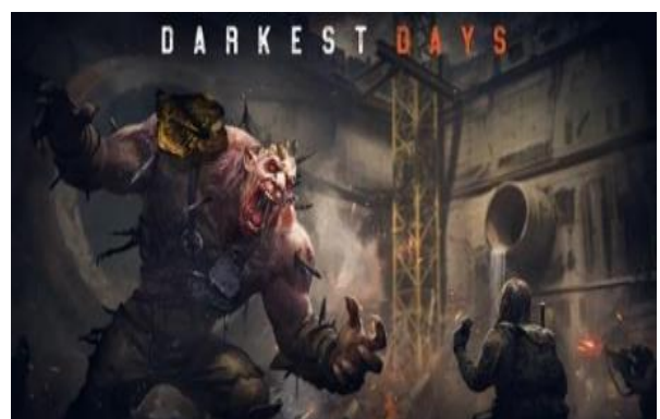
[도표 5] 좀비 아포칼립스 루터슈터 '다크리스트 데이즈' (1Q25)