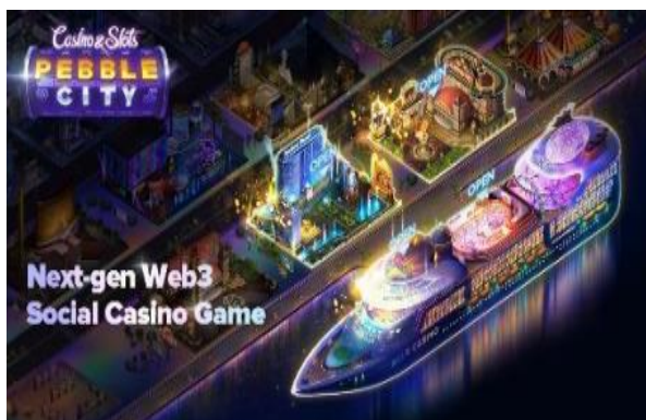
[도표 4] NHN 글로벌형 소셜카지노 게임 '페블시티' (2H24)