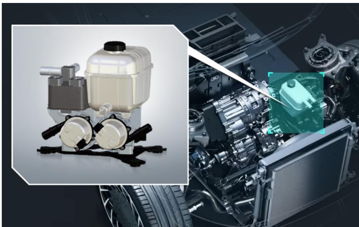
도표 2. 현대위아의 열관리 통합 모듈

주: 중단사업 제외 기준은 7월 공작기계 사업부의 매각 효과를 제거한 것 자료: 현대위아, 하나증권