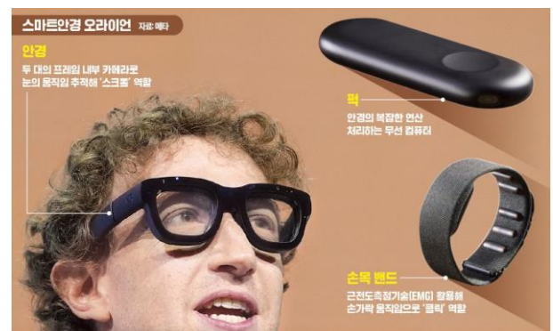
도표 5. Meta Orion: 안경 + 손목밴드 + 펍