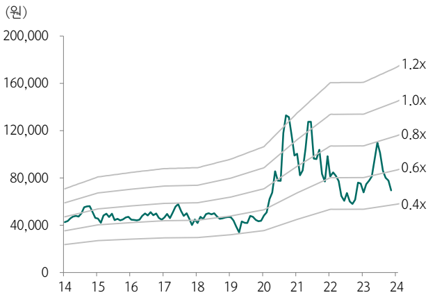
도표 3. 유니드 12M Fwd PBR 밴드 차트