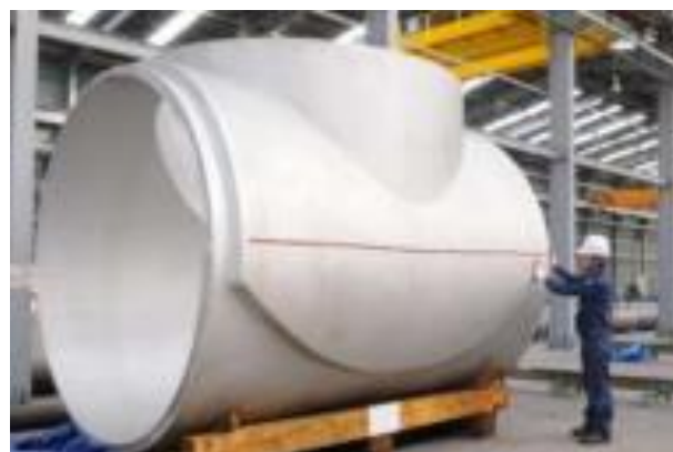
도표 3. Tee fitting