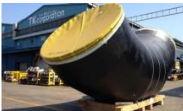
도표 2. Elbow fitting