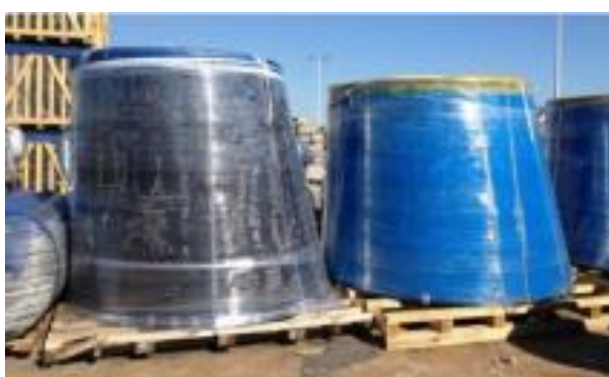
도표 2. Reducer fitting