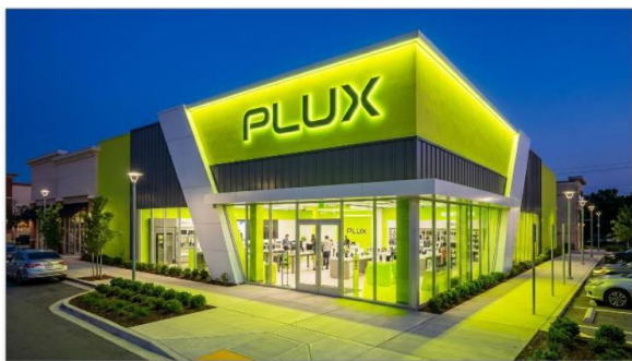
그림 4. 핵심 추진전략 ② PB(PLUX): 단독 매장 오픈