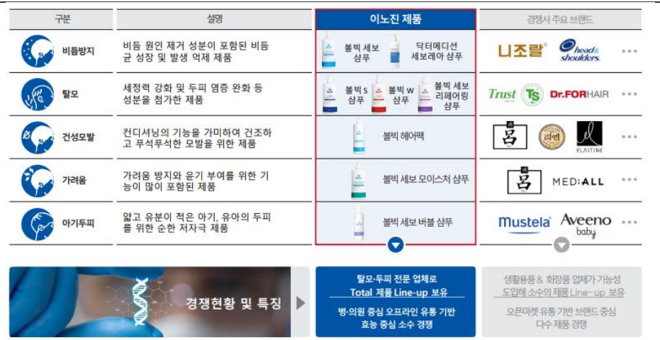
그림 1. 다양한 증상 방지를 위한 제품과 경쟁 현황