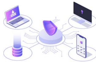
그림 1. 에스피소프트 SPLA 서비스 옵션

SPLA (Service Provider License Agreement)은