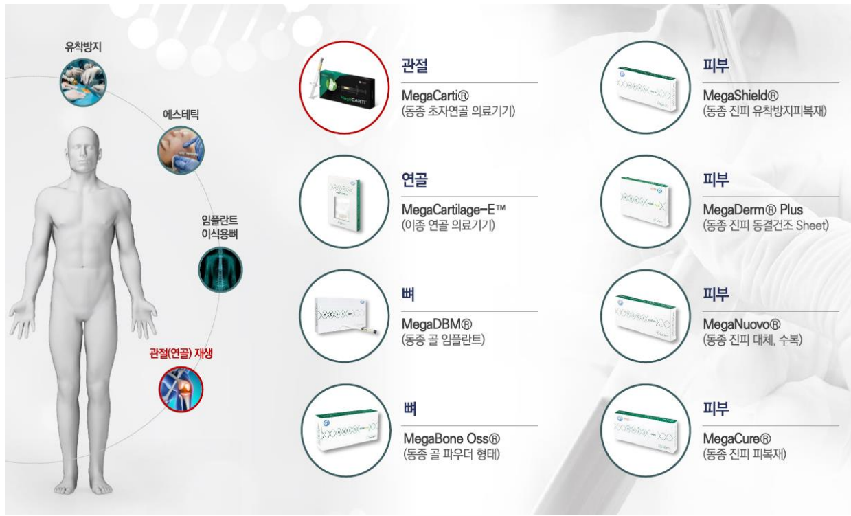
그림 5. 엘앤씨바이오 제품 포트폴리오