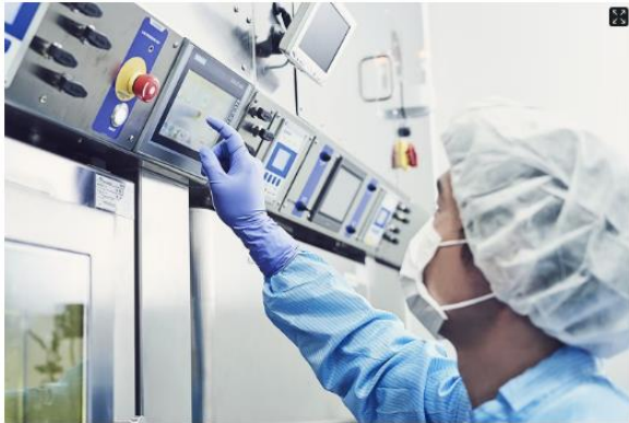
듀캄바이오 관계자가 방사성의약품 생산시설에서 약물 제조 시스템을 운영하고 있다.

기존 진단제 대비 영상 품질·정확도 등 우수 "정확한 환자 선별로 정밀 치료 지원"