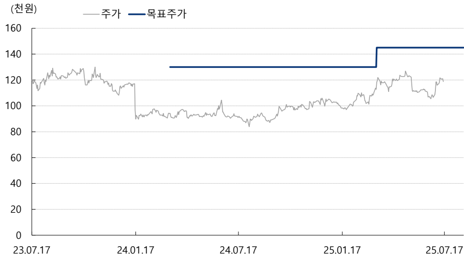
최근 2년간 목표주가 및 괴리율 추이