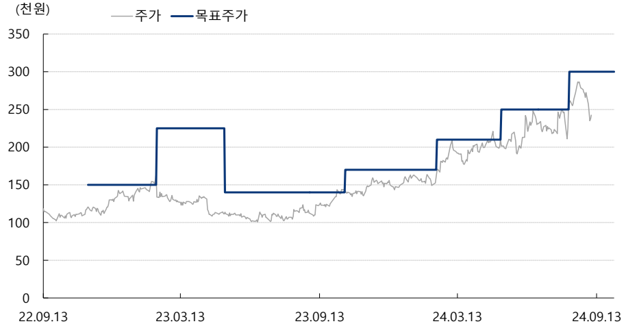
휴젤 최근 2년간 목표주가 변동추이