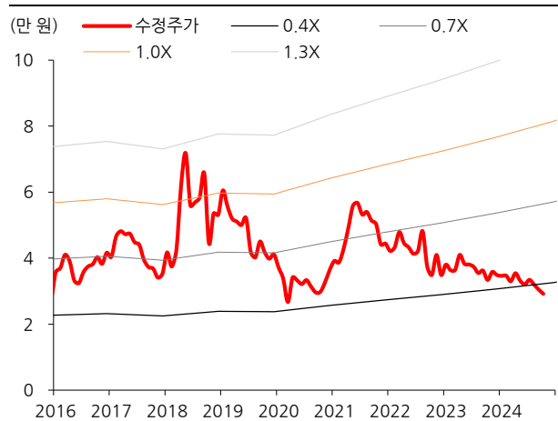
[그림2] 12M Fwd. P/B 밴드