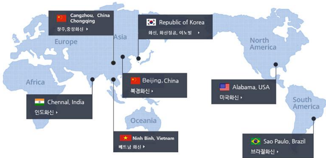
도표 2. 화신의 주요 주요 계열사 현황