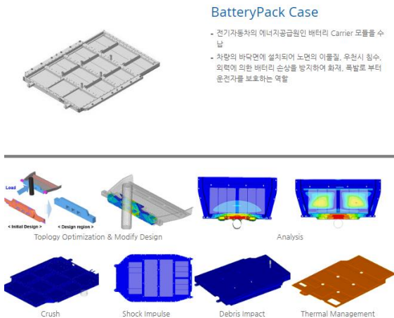
도표 3. 화신의 제품 중 배터리팩 케이스