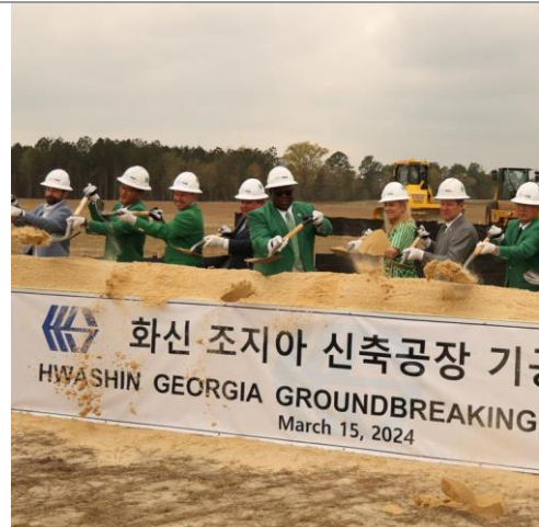
도표 4. 화신 조지아의 신축공장 기공식